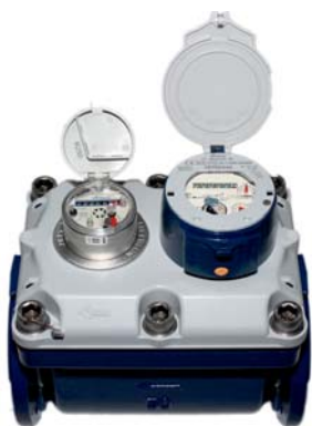
MB 1800UA MID